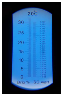
Imagem da escala do Refratômetro

(Essa unidade é usada para medir a quantidade de açúcares, dextrinas, proteínas e outras substâncias no mosto, ou, até mesmo, na cerveja, após a fermentação).